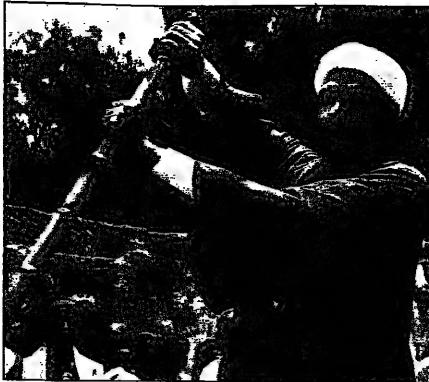
في لقطة من أحد أفلامه